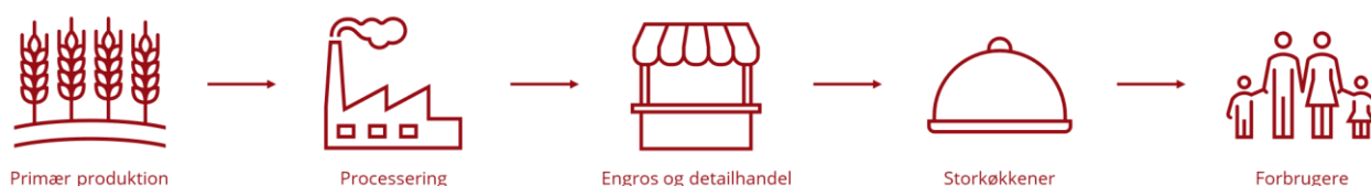
Figur 2: Værdikæden for agri-food sektoren som er målgruppen for indsatsområdet.

Målgruppen for indsatsen er bred, idet den omfatter både store, mellemstore og små fødevarer-producenter, herunder mange startups over hele værdikæden (se Figur 2).